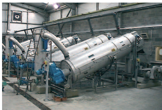
Parallell installation av sex HUBER Skruvpress S-PRESS