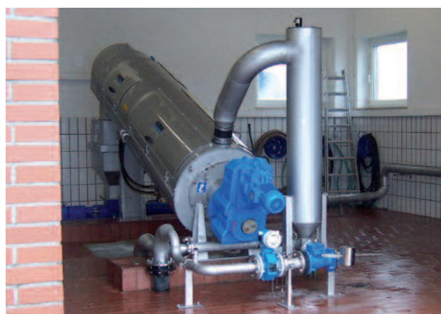
HUBER Skruvpress S-PRESS för 8 m 3 /h